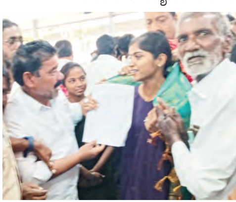
పాలకورت: జనవరి 10, (సాక్షి):- ప్రత్యేక తెలంగాణ రాష్ట్ర సాధనకు కృషి చేసిన ఉద్యమకారులను గుర్తించి