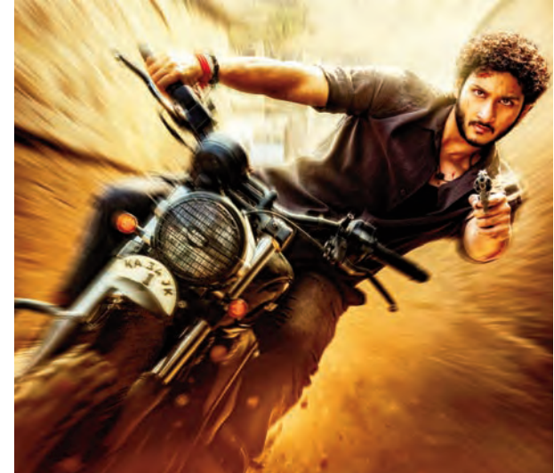
గన్ టూల్స్ గా పెట్టిన విధానం హై-స్పీడ్ చేతను సూచిస్తోంది. పవర్, ఇంటెన్సిటీని యాడ్ చేస్తోంది. ఈ సినిమాను టీవీ

చుట్టూ మోషన్ బ్లర్, అతని కళ్లలో కనిపించే పోకెస్..మొత్తం లుక్ కు