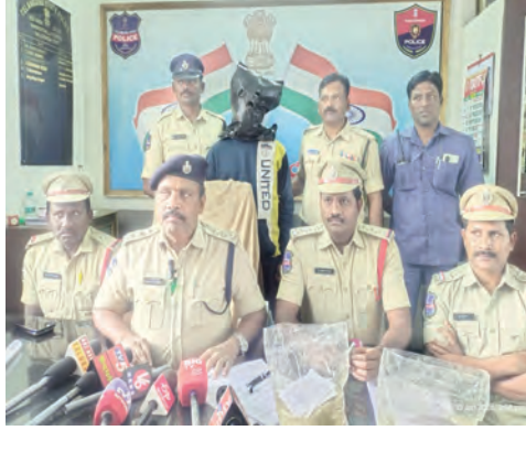
చిట్టాల జనవరి 10 (సాక్షి); అక్రమంగా ఓపియం హాస్పిటల్ అనే మాదకద్రవ్యాన్ని లారీ డ్రైవర్లకు విక్రయిస్తున్న

- 54 వేల విలువ గల తొమ్మిది కిలోల ఓపియం హాస్పిటల్ మొబైల్ స్వాధీనం