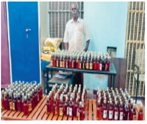
சோதனையில் வீட்டில் 350 மது பாட்டில்கள் பதுக்கி வைக்கப்பட்டு இருந்தது தெரியவந்தது. அதனை தொடர்ந்து சிங்கம்புணரி போலீஸார் பதுக்கிவைக்கப்பட்டிருந்த மது பாட்டில்களை கைப்பற்றினர்.