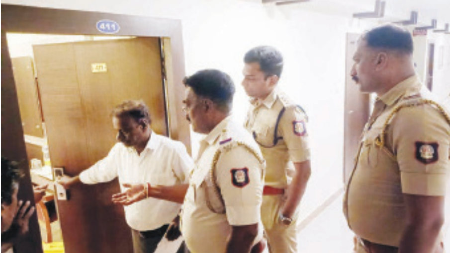
பழனியில் தனியார்தங்கும் விடுதிகளில் டி.எஸ்.பி. தனது செயல் தலைமையில், வெளி ஆட்கள் யாரும் தங்கி உள்ளார்களா என போலீஸார் சோதனை செய்தனர்