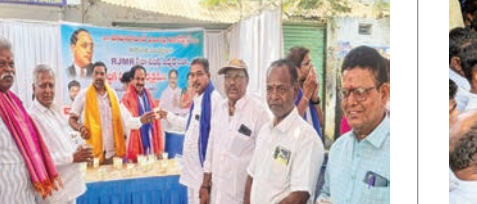
వివక్షను ఎదుర్కొంటూ ఉన్నత విద్యను అభ్యసించి దేశానికి అత్యున్నత రాజ్యాంగాన్ని అందించిన మహనీయుడు అంబేద్కర్ అని కొనియాడారు. సమానత్వం, న్యాయం, సామాజికత్వం కోసం ఆయన చేసిన కృషి ప్రతి ఒక్కరికి ఆదర్శమని పేర్కొన్నారు. ఈ కార్యక్రమంలో సంస్థ సభ్యులు, స్థానిక ప్రజలు పాల్గొని అంబేద్కర్ జయంతిని ఘనంగా నిర్వహించారు.