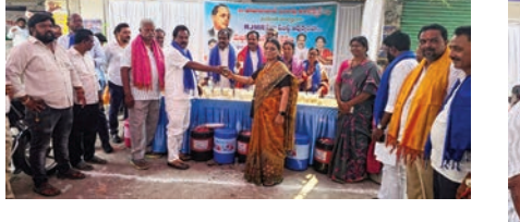
ఉప్పల్, ఏప్రిల్ 14 (సాక్షం): భారత రాజ్యాంగ నిర్మాత, సంఘ సంస్కర్త, భారతరత్న డాక్టర్ బి.ఆర్ అంబేద్కర్ 135వ జయంతి సందర్భంగా నాచారంలోని పీజేఎంఆర్ సేవా సంస్థ ఆధ్వర్యంలో మజ్జిగ పంపిణీ కార్యక్రమం నిర్వహించారు. ఈ సందర్భంగా పీజేఎంఆర్ చివ్రపట్టికి పూలమాలలు వేసి ఘనంగా నివాళులర్పించారు. అనంతరం ప్రజలకు మజ్జిగ పంపిణీ చేస్తూ ఆయన సేవలను స్మరించుకున్నారు. ఈ సందర్భంగా నిర్వాహకులు మాట్లాడుతూ అంబిరనితనం, కుల