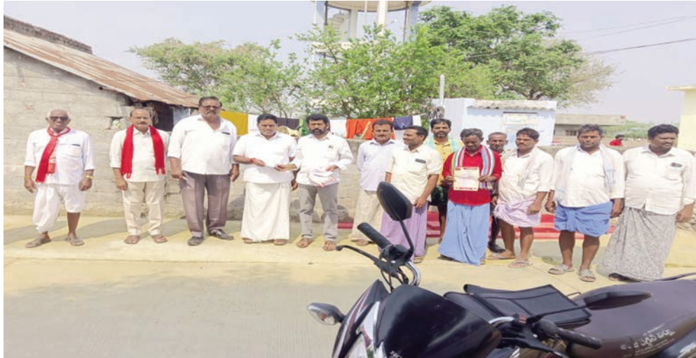
డి.డి. సాక్షం స్టాన్స్ : మండలంలోని కేంద్రం లోని జాతీయ రహదారిపై ఉన్నటువంటి ప్రైవేట్ హెల్త్ సెంటర్ ను 100 పడకల ఆసుపత్రిగా ప్రకటించాలని సిపిఐ డి.డి మండల పక్షాన్ని ప్రభుత్వాన్ని డిమాండ్ చేస్తున్నాం.