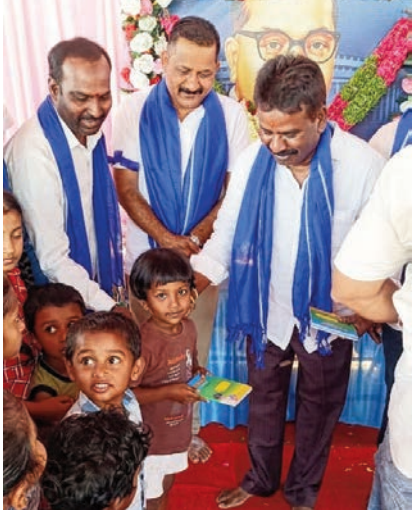
ఉప్పల్, ఏప్రిల్ (సాక్షం) 135వ అంబేద్కర్ జయంతి ఉత్సవాలు నాచారం డివిజన్ లో ఘనంగా నిర్వహించారు. రామచంద్ర నగర్ అంబేద్కర్ భవన్, బాబా నగర్, నాచారం విలేజ్, నాచారం వార్డ్ కార్యాలయం, ఎర్రగుంట వద్ద అంబేద్కర్ జయంతి సందర్భంగా ఘన నివాళు