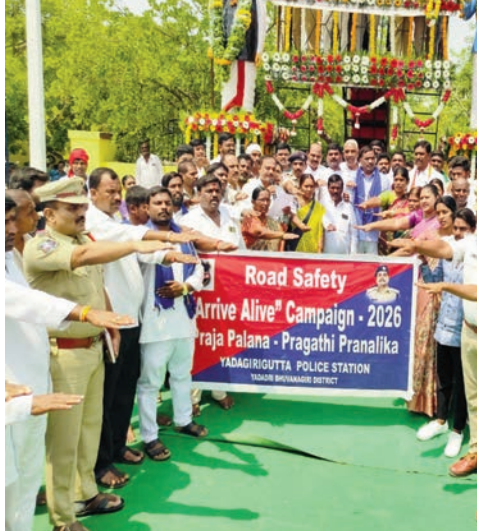
యాదగిరిగుట్ట సాక్షం స్టాన్స్. యాదగిరిగుట్ట అంబేద్కర్ గారు. చిన్నపాటి నుంచి ఎన్నో కష్టాలు ఎదుర్కొన్నప్పటికీ, విద్యను ఆయుధంగా తీసుకుని ప్రపంచ