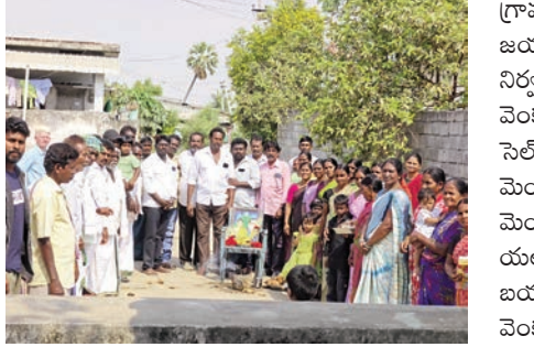
కోదాడ ఏప్రిల్ 14, (సాక్షి) తోగరాయి