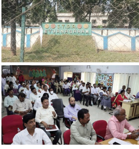
విటూరునగరం, ఏప్రిల్ 14, (సాక్షి) ; గిరిజనుల అభివృద్ధి కోసం నెల కొల్పోని బిడిపి ను గాలికొదిలే సినట్లైనా అని గిరిజన సంఘాల ఆరోపిస్తున్నాయి. చాలా

కాలంగా గిరిజనుల అభివృద్ధిని అధికారులు పట్టించుకోవడం లేదని గ్రీవెన్స్ లో వినతులు సమర్పించి తిరిగి ఇండ్లకు వెళ్ళే విధంగా సదున్నంది పాలనా విధానం ఆరోపణలు చేస్తున్నారు. ప్రస్తుతం ప్రాజెక్ట్ అధికారి లేక పోవడంతో కార్యాలయం రాజు లేని రాజ్యంగా మారిందని విమర్శలు వస్తున్నాయి. పీఓ ఉన్నప్పటి అధికారులు ఇప్పటికీ రాజు నడుచుకున్నారని ఆరోపణలు చేస్తున్నారు. ఎవరూ అడిగే వాళ్ళు లేకపోవడంతో ఇంచార్జిగా ములుగు కలెక్టర్ తీసుకున్నారు. జిల్లా కార్యాలయంలోనే బిడిపి ఉండే కలెక్టర్ బిడిపిను ఏం చూస్తారు, గ్రీవెన్స్ దేలో వారం వారం గిరిజనులు ఇప్పటి అర్జీలు పేరుతో స్వీకరిస్తున్నారని తప్పా వాటి పరిష్కారాలు