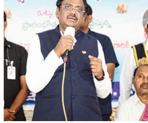
పాధి పొందాలని, కుటుంబ అభివృద్ధి కృషి చేయాలని తెలిపారు. స్వయం సహాయక సంఘాల మహిళలకు ప్రభుత్వ పాఠశాల విద్యార్థిని విద్యార్థుల ఏకరూప దుస్తులను తయారు చేసేందుకు కల్పించిన అవకాశాన్ని సద్వినియోగం చేసుకున్నారు, ఇదే తరహాలో భవిష్యత్తులో మరిన్ని అవకాశాలు కల్పించడం జరుగుతుందని, పనిలో నిష్ణాత ప్రమాణాలు పాటించాలని తెలిపారు. డా. బి.ఆర్. అంబేద్కర్ రచించిన రాజ్యాంగంలో మహిళ రిజర్వేషన్ పొందుపరిచారని తెలిపారు. రాష్ట్ర ప్రభుత్వం మహిళల కుటుంబ యజమానిగా గుర్తిస్తూ ఇందిరమ్మ ఇండ్లు, మహిళాశక్తి పథకంలో ఉచిత బస్సు ప్రయాణం, 500 రూపాయలకు రాయితీ గ్యాస్, గృహశక్తి పథకంలో 200 యూనిట్ల ఉచిత విద్యుత్, రేషన్ కార్డు అందించి ప్రజా సంక్షేమానికి కృషి చేస్తుందని తెలిపారు. బ్యాంకు లింకేజీ ద్వారా దాదాపు 3 వేల కోట్ల రుణ సదుపాయం కల్పించి మహిళల ఆర్థిక అభివృద్ధికి తోడ్పాలు అందించడం జరిగిందని తెలిపారు. జిల్లా కలెక్టర్ మాట్లాడుతూ కుట్టు మిషన్ కోసం దరఖాస్తు చేసుకున్న అర్హులందరికీ మిషన్లు సముదాయం సంబంధిత పటాన్ని పరిశీలించారు. ఈ కార్యక్రమంలో సంబంధిత అధికారులు, ప్రజా ప్రతినిధులు తదితరులు పాల్గొన్నారు.