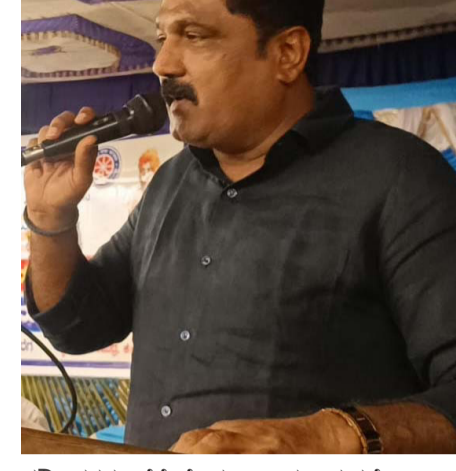
ಮೌಲ್ಯಗಳನ್ನು ಬೆಳೆಸಿಕೊಳ್ಳಲು ಸಾಧ್ಯವಾಗುತ್ತದೆ. ಗ್ರಾಮೀಣ ಪರಿಸರದಲ್ಲಿ ಸೇವಾ ಮಾಡುವ ಮೂಲಕ ಉತ್ತಮ ವ್ಯಕ್ತಿತ್ವ