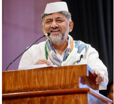
ನಾವೆಲ್ಲರೂ ಕೆಲಸ ಮಾಡಬೇಕಾಗುತ್ತದೆ" ಎಂದರು.

ಏನೂ ಹೇಳದೇ, ಅವರು ಏನೂ ಸೂಚನೆ ಕೊಡದೆ, ನಾವು ಏನೂ ಮಾಡಲೂ ಆಗುವುದಿಲ್ಲ. ಕೆಲವನ್ನು ಮಾರ್ಗದರ್ಶನದ ಅನುಸಾರವಾಗಿ ಮಾಡಬೇಕಾಗುತ್ತದೆ. ಕೆಲವರು ನನ್ನ ಮೇಲೆ ದೂರಬಹುದು. ಹಾಗೇ ನನ್ನ ಮೇಲೆ ಹೇಳಿದರೂ ಚಿಂತೆಯಿಲ್ಲ. ಪಕ್ಷದ ಶಿಸ್ತಿನ ಚೌಕಟ್ಟಿನಲ್ಲಿ