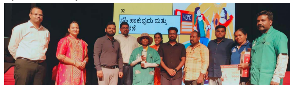
ಬಾಟಲ್, ಟೋಪಿ, ಹ್ಯಾಂಡ್ ಸ್ಪ್ರೇಸ್) ವಿತರಣೆ ಕಾರ್ಯಕ್ರಮ ನಡೆಯಿತು.

ನಗರದಲ್ಲಿ ಘನತ್ಯಾಜ್ಯ ನಿರ್ವಹಣೆಯನ್ನು ಇನ್ನಷ್ಟು ಪರಿಣಾಮಕಾರಿಯಾಗಿ ಜಾರಿಗೊಳಿಸಲು ಅಧಿಕಾರಿಗಳು ಹಾಗೂ ಪೌರಕಾರ್ಮಿಕರು ಹೆಚ್ಚಿನ ಶ್ರಮ ವಹಿಸಬೇಕು ಎಂದು ಸೂಚಿಸಿದರು.