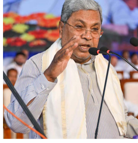
ಎರಡು ದಿನಗಳ ಅಂತಾರಾಷ್ಟ್ರೀಯ ಸಮ್ಮೇಳನ ಏಪ್ರಿಲ್ 18 ರಂದು ಬೆಂಗಳೂರಿನ ಶಾಂಗೈ-ಲಾ ಹೋಟೆಲ್‌ನಲ್ಲಿ ನಡೆಯಲಿದ್ದು, ಸುತ್ತೀಂಕೋರ್ಟ್‌ನ ಮುಖ್ಯ

ವಹಿಸುತ್ತದೆ. ಈ ಸಮ್ಮೇಳನವು ಭಾರತದ ಇಂಧನ ಪರಿವರ್ತನೆ, ನೀತಿ ಮತ್ತು ಆಡಳಿತದ ಕುರಿತು ಸಂವಾದಕ್ಕೆ ವೇದಿಕೆಯನ್ನು ಒದಗಿಸಲಿದ್ದು, 2047ರ ವೇಳೆಗೆ ಇಂಧನ ಭದ್ರತೆ ಮತ್ತು ಸುಸ್ಥಿರತೆಗಾಗಿ ರಾಷ್ಟ್ರೀಯ ಗುರಿಗೆ ಅನುಗುಣವಾಗಿರುತ್ತದೆ.