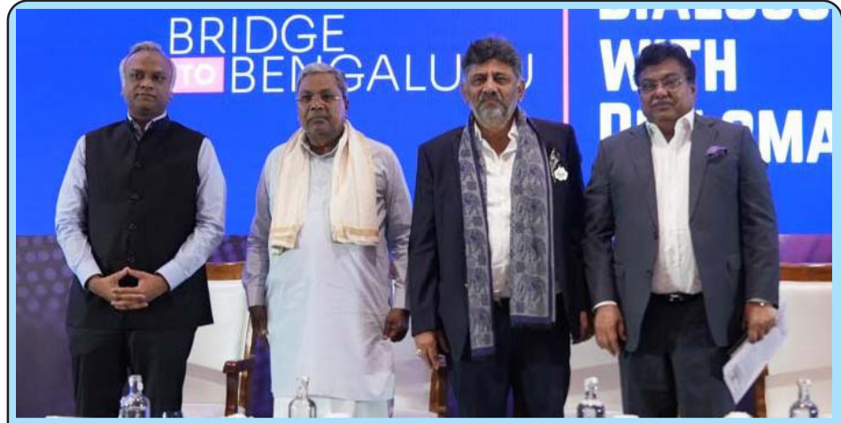
ಬೆಂಗಳೂರಿನಲ್ಲಿ ನವೆಂಬರ್ ತಿಂಗಳಲ್ಲಿ ನಡೆಯಲಿರುವ BENGALURU TECH SUMMITನ ಪೂರ್ವಭಾವಿಯಾಗಿ ದೆಹಲಿಯಲ್ಲಿ ನಡೆದ ವಿವಿಧ ರಾಷ್ಟ್ರಗಳ ರಾಯಭಾರಿಗಳು ಹಾಗೂ ಹೈ ಕಮಿಷನರ್ ಗಳ ಜೊತೆಗಿನ ಸಂವಾದದಲ್ಲಿ (Bridge to BENGALURU) ಮುಖ್ಯಮಂತ್ರಿ ಸಿದ್ದರಾಮಯ್ಯ ಅವರು ಭಾಗವಹಿಸಿದ್ದರು. ಉಪ ಮುಖ್ಯಮಂತ್ರಿ ಡಿ.ಕೆ. ಶಿವಕುಮಾರ್, ಬೃಹತ್ ಕೈಗಾರಿಕಾ ಸಚಿವ ಎಂ.ಬಿ. ಪಾಟೀಲ್, ಐಟಿ ಸಚಿವ ಪ್ರಿಯಾಂಕಾ ಖರ್ಗೆ ಅವರು ಇದ್ದರು.