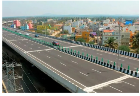
ನಿರ್ಮಾಣಕ್ಕೆ ಕರ್ನಾಟಕ ಕಾಂಗ್ರೆಸ್ ಸರ್ಕಾರವು ಮುಂದಾಗಿದೆ. ಅಲ್ಲದೆ ಈ ಅಭಿವೃದ್ಧಿ ಕಾಮಗಾರಿಗಳಿಗೆ ಸಂಬಂಧಿಸಿದಂತೆ ಕರ್ನಾಟಕ ಸರ್ಕಾರವು ಬುರೋಬ್ಬರಿ 13,262 ಕೋಟಿ ರೂ. ಅನುದಾನವನ್ನು ಮೀಸಲಿರಿಸಿದೆ.

ಬೆಂಗಳೂರಿನ ಅಭಿವೃದ್ಧಿ ಕಾಮಗಾರಿಗಳಿಗೆ ಸಂಬಂಧಿಸಿದಂತೆ ಕರ್ನಾಟಕ ಸರ್ಕಾರವು ಭರ್ಜರಿ ಗುಡ್‌ನ್ಯೂಸ್ ಕೊಟ್ಟಿದೆ. ಬೆಂಗಳೂರಿನ ಪ್ರಮುಖ ರಸ್ತೆಗಳ ಅಭಿವೃದ್ಧಿ ಹಾಗೂ 11 ಎಲಿವೇಟೆಡ್ ಕಾರಿಡಾರ್‌ಗಳ