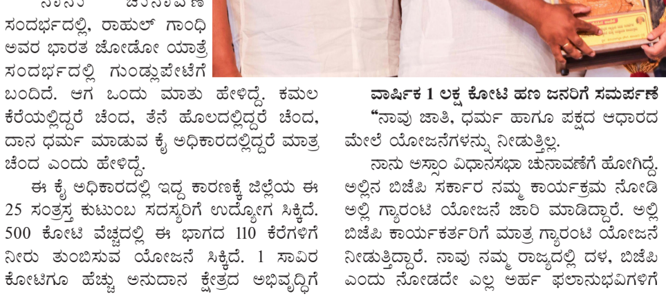
ವಾರ್ಷಿಕ 1 ಲಕ್ಷ ಕೋಟಿ ಹಣ ಜನರಿಗೆ ಸಮರ್ಪಣೆ

ಬಂದಿದೆ. ಇವುಗಳ ಜೊತೆಗೆ ಪಂಚ ಗ್ಯಾರಂಟಿ ಯೋಜನೆಗಳು ನಿಮ್ಮನ್ನು ತಲುಪಿವೆ. ಮಹಿಳೆಯರು ಉಚಿತವಾಗಿ ಬಸ್ ಪ್ರಯಾಣ ಮಾಡುತ್ತಿದ್ದಾರೆ. ಬಡ ಕುಟುಂಬದ ಮಹಿಳೆಗೆ ಮಾಸಿಕ 2 ಸಾವಿರ ರೂಪಾಯಿ ಹಣ ಬರುತ್ತಿದೆ. ಬಡವರಿಗೆ ತಿಂಗಳಿಗೆ 10 ಕೆ.ಜಿ ಅಕ್ಕಿ, 200 ಯೂನಿಟ್ ವರೆಗೂ ಉಚಿತ ವಿದ್ಯುತ್, ನಿರುದ್ಯೋಗಿ ಯುವಕರಿಗೆ ನಿರುದ್ಯೋಗ ಭತ್ಯೆ ನೀಡಲಾಗುತ್ತಿದೆ” ಎಂದು ವಿವರಿಸಿದರು.