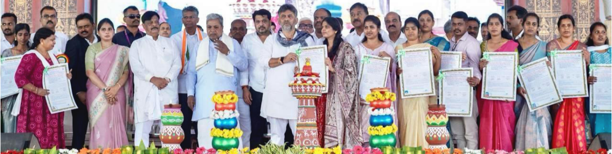
ನೇಮಕಾತಿ ಪತ್ರಗಳನ್ನು ಹಸ್ತಾಂತರ ಮಾಡಿದರು. ಸಂತ್ರಸ್ತರಿಗೆ ಚಾಮರಾಜನಗರ ವೈದ್ಯಕೀಯ ವಿಜ್ಞಾನ ಸಂಸ್ಥೆಗಳ ಬೋಧನಾ ಅಸ್ಥಾನದಲ್ಲಿ (ಸಿಎಸ್) ವಿವಿಧ ವೃಂದದ ಉದ್ಯೋಗಗಳನ್ನು ನೀಡಲಾಗಿದೆ. ಭಾರತ್ ಜೋಡೋ ಯಾತ್ರೆ ವೇಳೆಗೆ ಸಂತ್ರಸ್ತ ಕುಟುಂಬಗಳ ಸದಸ್ಯರಿಗೆ ಸರ್ಕಾರಿ ಉದ್ಯೋಗದ ನೀಡುವ ಭರವಸೆಯನ್ನು ಕಾಂಗ್ರೆಸ್ ನಾಯಕ ರಾಮಲ್ ಗಾಂಧಿ ನೀಡಿದ್ದರು. ಅದರಂತೆ ಸಂತ್ರಸ್ತ ಕುಟುಂಬಗಳ 25 ಮಂದಿಗೆ ಚಾಮರಾಜನಗರ ವೈದ್ಯಕೀಯ ಕಾಲೇಜು ಆಸ್ಪತ್ರೆಯಲ್ಲಿ ಜಾಯಂ ನೌಕರಿಯನ್ನು ರಾಜ್ಯ ಸರ್ಕಾರ ನೀಡಿದೆ. ರಾಜ್ಯದಲ್ಲಿ ಕೊರೋನಾ ಮಹಾಮಾರಿ ಅಬ್ಬರದ ಸಂದರ್ಭ, ಕೋವಿಡ್ ಎರಡನೇ ಅಲೆಯ ವೇಳೆಗೆ ಚಾಮರಾಜನಗರ ಜಿಲ್ಲಾ ಆಸ್ಪತ್ರೆಯಲ್ಲಿ ಬಾರಿ ದುರಂತವೊಂದು ನಡೆದಿತ್ತು. 2021, ಮೇ 20ರಂದು ಜಿಲ್ಲಾ ಕೋವಿಡ್ ಆಸ್ಪತ್ರೆಯಲ್ಲಿ ಚಿಕಿತ್ಸೆಗೆ ದಾಖಲಾಗಿದ್ದ 36 ಮಂದಿ ಆಮ್ಲಜನಕ ಸಿಗದ ಧಾರಾಣವಾಗಿ ಮೃತಪಟ್ಟಿದ್ದರು. ದುರ್ಘಟನೆ ನಡೆದಾಗ ಬಿಜೆಪಿ ಸರ್ಕಾರ ಅಧಿಕಾರದಲ್ಲಿದ್ದು, ಆಮ್ಲಜನಕದ ಕೊರತೆಯಿಂದಾಗಿ ಒಟ್ಟು 36 ಮಂದಿ ಪ್ರಾಣಕಳೆದು ಕೊಂಡಿದ್ದು, ಈ ವಿಚಾರದೇಶಾದ್ಯಂತ