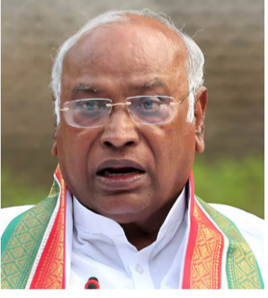
ಮಲ್ಲಿಕಾರ್ಜುನ ಖರ್ಗೆ, ಸಮಾನತೆ ಮತ್ತು ನ್ಯಾಯದ ಮೇಲೆ ನಂಬಿಕೆ ಇರದ ಭಯೋತ್ಪಾದಕ ಎಎಎಂಐಎಂ ಕೆಲಸವನ್ನು ಟೀಕಿಸಿದರು ಮತ್ತು ಪ್ರಧಾನಿ ಮೋದಿಯವರನ್ನು 'ಸಮಾನತೆಯಲ್ಲಿ ನಂಬಿಕೆಯಿಲ್ಲದ ಭಯೋತ್ಪಾದಕ' ಎಂದು ಟೀಕಿಸಿದರು.

ಚಿನ್ನೈ: ಕಾಂಗ್ರೆಸ್ ಅಧ್ಯಕ್ಷ ಮಲ್ಲಿಕಾರ್ಜುನ ಖರ್ಗೆ ಅವರು ಮಂಗಳವಾರ ಪ್ರಧಾನಿ ನರೇಂದ್ರ ಮೋದಿ ಅವರನ್ನು "ಭಯೋತ್ಪಾದಕ" ಎಂದು ಟೀಕಿಸುವ ಮೂಲಕ ವಿವಾದ ಮೈಮೇಲೆ ಎಳೆದುಕೊಂಡಿದ್ದಾರೆ. ತಮಿಳುನಾಡಿನಲ್ಲಿ ಚುನಾವಣಾ ಪ್ರಚಾರದ ಕೊನೆಯ ದಿನವಾದ ಇಂದು ಚಿನ್ನೈನಲ್ಲಿ ಸುದ್ದಿಗೋಷ್ಠಿ ಉದ್ದೇಶಿಸಿ ಮಾತನಾಡಿದ ಖರ್ಗೆ ಅವರು, "ಟೆರರಿಸ್ಟ್ ಪ್ರಧಾನಿ ಮೋದಿ ಅವರೊಂದಿಗೆ ಎಎಎಂಐಎಂ ಕೈಜೋಡಿಸಿರುವುದು ನಿಜಕ್ಕೂ ವಿಷಾದನೀಯ ಎಂದು ಹೇಳಿದರು. ಮಹಿಳಾ ಮೀಸಲಾತಿ ಮಸೂದೆ ಮತ್ತು ಕ್ಷೇತ್ರ ಪುನರ್ ವಿಂಗಡಣೆ ಮಸೂದೆಯನ್ನು ಸೋಲಿಸುವ ಸಮಯದಲ್ಲಿ ವಿರೋಧ ಪಕ್ಷದ ಒಗ್ಗಟ್ಟನ್ನು ಎತ್ತಿ ತೋರಿಸಿದ ಕಾಂಗ್ರೆಸ್ ಅಧ್ಯಕ್ಷರು, ಬಿಜೆಪಿಯನ್ನು ಬೆಂಬಲಿಸಿದ್ದಕ್ಕಾಗಿ ಎಎಂಐಎಂ ಕೆಲಸವನ್ನು ಟೀಕಿಸಿದರು ಮತ್ತು ಪ್ರಧಾನಿ ಮೋದಿಯವರನ್ನು 'ಸಮಾನತೆಯಲ್ಲಿ ನಂಬಿಕೆಯಿಲ್ಲದ ಭಯೋತ್ಪಾದಕ' ಎಂದು ಟೀಕಿಸಿದರು. ತಮಿಳುನಾಡಿನಲ್ಲಿ ಎಎಎಂಐಎಂ ಮತ್ತು ಬಿಜೆಪಿ ನಡುವಿನ ಮೈತ್ರಿಯ ಔಚಿತ್ಯವನ್ನು ಪ್ರಶ್ನಿಸಿದ