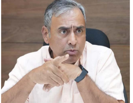
ಸಂಚಾರಿ ಪೊಲೀಸ್ ವಿಭಾಗದೊಂದಿಗೆ ಸಮನ್ವಯ ಸಭೆ ನಡೆಸಿ ಜಿಎಫ್‌ಸಿಗಳನ್ನು ಅಂತಿಮಗೊಳಿಸಿ ಆಯಾ ನಗರ ಪಾಲಿಕೆಗಳಿಗೆ ನೀಡಲಾಗಿದೆ. ಈ ವೈಕೆ 10 ಜಂಕ್ಷನ್‌ಗಳಲ್ಲಿ ಕೆಲಸ ಪ್ರಾರಂಭಿಸಲಾಗಿದ್ದು, ತೀವ್ರಗತಿಯಲ್ಲಿ ಕಾಮಗಾರಿಯನ್ನು ಪೂರ್ಣಗೊಳಿಸಲು ಅಧಿಕಾರಿಗಳಿಗೆ