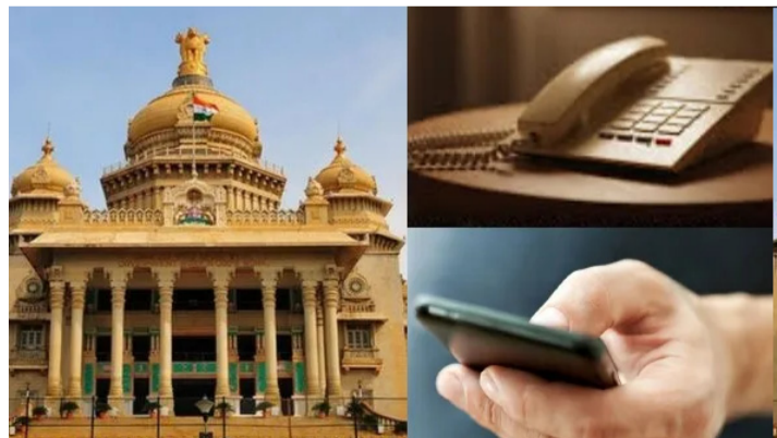
ಉಪಾಧ್ಯಕ್ಷರಾಗಿ ನೇಮಕ ಮಾಡಿ ಆದೇಶ ಹೊರಡಿಸಲಾಗಿದೆ.

ತುಂಬುತ್ತಿದೆಯೋ ದೇವರಿಗೆ ಗೊತ್ತು. ಜನಸಂದನ ವೇದಿಕೆ ಜನಸಂದನ ಎನ್ನುವ ಅಪ್ಲಿಕೇಷನ್ ಅಭ್ಯವಿದೆ. ಅದರಲ್ಲಿ ಯಾವುದೇ ಇಲಾಖೆಯನ್ನು ಟ್ಯಾಗ್ ಮಾಡಿ ದೂರು ನೀಡಲು ಅವಕಾಶವಿದೆ. ಹಾಗೆಯೇ ದೂರುಗಳನ್ನು ಟ್ಯಾಗ್ ಕೂಡ ಮಾಡಬಹುದು. ಮೇಲೆ ಉಲ್ಲೇಖಿಸಿದ ಪ್ರಕರಣದಲ್ಲಿಯೇ ನಾನು ಫೋಟೋ ಸಮೇತ ದೂರು ನೀಡಿದ್ದೆ. ಈ ವೇದಿಕೆ ಎಷ್ಟು ಅಧುತವಾಗಿ ಕೆಲಸ ಮಾಡುತ್ತಿದೆ ಎಂದರೆ, ಯಾವ ಕ್ರಮ ಜರುಗಿಸಲಾಯಿತು, ಏನಾಯಿತು ಎನ್ನುವ ಂಸಾಮುದೇ ವಾಹಿನಿಯಲ್ಲದೇ ದೂರದ ನನ್ನ ಮುಕ್ತಾಯಗೊಳಿಸಿದ್ದರು. ಆದರೆ ವಾಸ್ತವದಲ್ಲಿ ನಾನು ನೀಡಿದ್ದ ಸಮಸ್ಯೆಯು ಇಂದಿಗೂ ಮುಂದುವರಿದಿದೆ. ಬ್ಯಾಂಕಿಂಗ್ ವಲಯ ಬಹುತೇಕ ಎಲ್ಲ ಬ್ಯಾಂಕ್‌ಗಳು ಸಹಾಯವಾಣಿಯನ್ನು ಹೊಂದಿವೆ. ಹಾಗೆಯೇ ಕುಖ್ಯಾತ ಎಸ್‌ಬಿಐನಲ್ಲೂ ಈ ಅಭಿವೃದ್ಧಿಯಿದೆ. ಇತ್ತೀಚೆಗೆ ನನ್ನ ಖಾತೆಯ ಕೆಪೈಸಿ ಮಾಡಿಕೊಳ್ಳುವಂತೆ ಸಂದೇಶ ಬಂದಿತ್ತು. ಅವರ ವೆಬ್‌ಸೈಟ್ ಹೇಳುವಂತೆಯೇ ಯುನೋ ಅಪ್ಲಿಕೇಷನ್, ಸಹಾಯವಾಣಿಗೆ ಕರೆ, ಎಟಿಎಂ ಹಾಗೂ ಬ್ಯಾಂಕ್ ವೆಬ್‌ತಾಣದ ಮೂಲಕ ಕೆಪೈಸಿ ಅಪ್ಲೇಟ್ ಮಾಡಲು ಪ್ರಯತ್ನಿಸಿದೆ. ದಿನಗಟ್ಟಲೆ ಪ್ರಯಾಸದ ಬಳಿಕವೂ ತಾಂತ್ರಿಕ ದೋಷವನ್ನುವ ಕಾರಣ ನೀಡುತ್ತೇ ಇತ್ತು. ಈ ಸಂಬಂಧ ದೂರು ನೀಡಿ, ಸ್ಪಷ್ಟನೆ ಕೇಳಲು ಸಹಾಯವಾಣಿಗೆ ಕರೆ ಮಾಡಿದೆ. ಅಲ್ಲಿ ಕುಳಿತು ಸಿಬ್ಬಂದಿಯು ಎಸ್‌ಬಿಐ ಕಚೇರಿಯಲ್ಲಿ ಊಟಕ್ಕೆ ಹೋಗುವ ಸಿಬ್ಬಂದಿಗಿಂತ ಕಟ್ಟಿದಾಗಿದ್ದರು. ಸಮಸ್ಯೆಗಳ ಬಗ್ಗೆ ದೂರು ಪಡೆಯಲು ಸಾಧ್ಯವಿಲ್ಲ. ನೀವು ಹತ್ತಿರದ ಕಚೇರಿಗೆ ಭೇಟಿ ನೀಡಿ ಎಲ್ಲ ಕೈ ತೊಳೆದುಕೊಂಡರು. ತಾಂತ್ರಿಕ ದೋಷವು ನಿಮ್ಮ ಕಡೆಯಿಂದಿದ್ದರೆ ದೂರು ಪಡೆದುಕೊಂಡು ಸರಿಪಡಿಸಬಹುದಲ್ಲವೇ ಎಂದು ಕೇಳಿದರೆ, ಅದೇಲ್ಲ ಆಗುವುದಿಲ್ಲ ಎಂದು ಸುಮ್ಮನಾಗಿಬಿಟ್ಟರು.