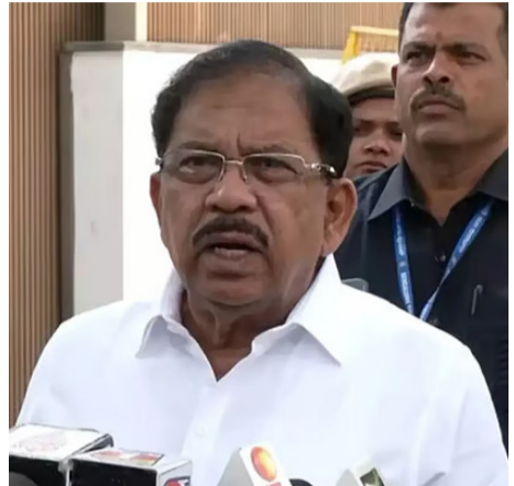
ಸಲ್ಲಿಸಲು ಈಗಾಗಲೇ ಸೂಚನೆ ನೀಡಲಾಗಿದೆ ಎಂದು ಹೇಳಿದರು.

ಅತ್ತ ಮಾಹಿತಿ ಸಿಗುವವರೆಗೂ ತನಿಖೆ ನಡೆಸುತ್ತಾರೆ. ಟೆಕ್ನಿಕಲ್ ಅಗಿರುವುದರಿಂದ ಮಾಹಿತಿಗಳನ್ನು ಕಲೆ ಹಾಕುವುದರಲ್ಲಿ ವಿಳಂಬ ಆಗಿದೆ ಎಂದು ಅನಿಸುತ್ತದೆ. ಶೀಘ್ರವಾಗಿ ಪೂರ್ಣಗೊಳಿಸಿ, ಮಧ್ಯಂತರ ಚಾರ್ಜ್‌ಶೀಟ್