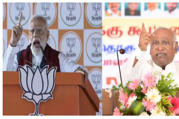
ಅಧಿಕಾರಿಗಳ ಸಭೆಯಲ್ಲಿ ಮಾತನಾಡುತ್ತಿರುವ ಖರ್ಗೆ ಮತ್ತು ಮೋದಿ.

"ಅವರು ಪ್ರಧಾನಿ ಮೋದಿ ಜೊತೆ ಹೇಗೆ ಕೈಜೋಡಿಸಿದ್ದಾರೆ ಎಂಬುದು ಅರ್ಥವಾಗುತ್ತಿಲ್ಲ. ನರೇಂದ್ರ ಮೋದಿ ಒಪ್ಪ ಭಯೋತ್ಪಾದಕ. ಅವರ ಪಕ್ಷ ಸಮಾನತೆ ಮತ್ತು ನ್ಯಾಯದಲ್ಲಿ ನಂಬಿಕೆ ಇಡುವುದಿಲ್ಲ. ಈ ಜನರು ಅವರೊಂದಿಗೆ ಕೈಜೋಡಿಸುತ್ತಿದ್ದಾರೆ ಎಂದರೆ ಅವರು ಪ್ರಜಾಪ್ರಭುತ್ವವನ್ನು ದುರ್ಬಲಗೊಳಿಸುತ್ತಿದ್ದಾರೆ ಎಂದೇ ಅರ್ಥ" ಎಂದು ಮಲ್ಲಿಕಾರ್ಜುನ ಖರ್ಗೆ ಎಎಎಎಂಎಂ ಕೆಎಸ್ ಪಕ್ಷವನ್ನು ತರಾಟೆಗೆ ತೆಗೆದುಕೊಂಡಿದ್ದಾರೆ. ಅಂಬೇಡ್ಕರ್ ಜಯಂತಿ ದಿನ ಪ್ರಧಾನಿ ಮೋದಿ-ಮಲ್ಲಿಕಾರ್ಜುನ ಖರ್ಗೆ ಆಪ್ತ ಸಮಾಲೋಚನೆ ನಡೆಸಿದ್ದನ್ನು ಇಲ್ಲಿ ಸ್ಮರಿಸಬಹುದು. ತಮಿಳುನಾಡಿನಲ್ಲಿ ಎಎ ಎಡಿ ಎಂಕೆ ಮತ್ತು ಬಿಜೆಪಿ ಒಟ್ಟಾಗಿ ಚುನಾವಣೆ ಎದುರಿಸುತ್ತಿವೆ. ಪ್ರಧಾನಿ ಮೋದಿ, ಗೃಹ