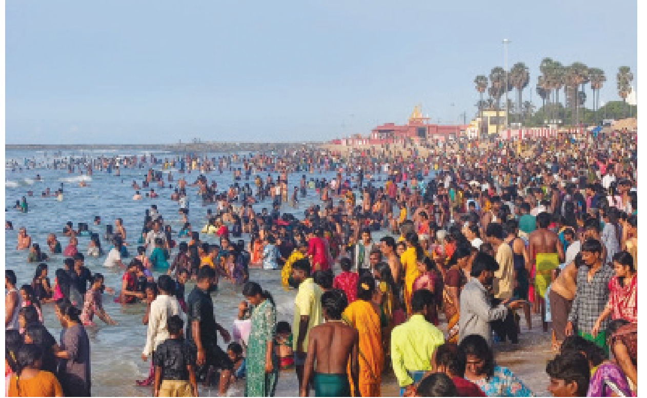
திருச்செந்தூர் கோவிலில் இன்றும் ஏராளமான பக்தர்கள் குவிந்தனர். அவர்கள் கடலில் புனித நீராடிய காட்சி.