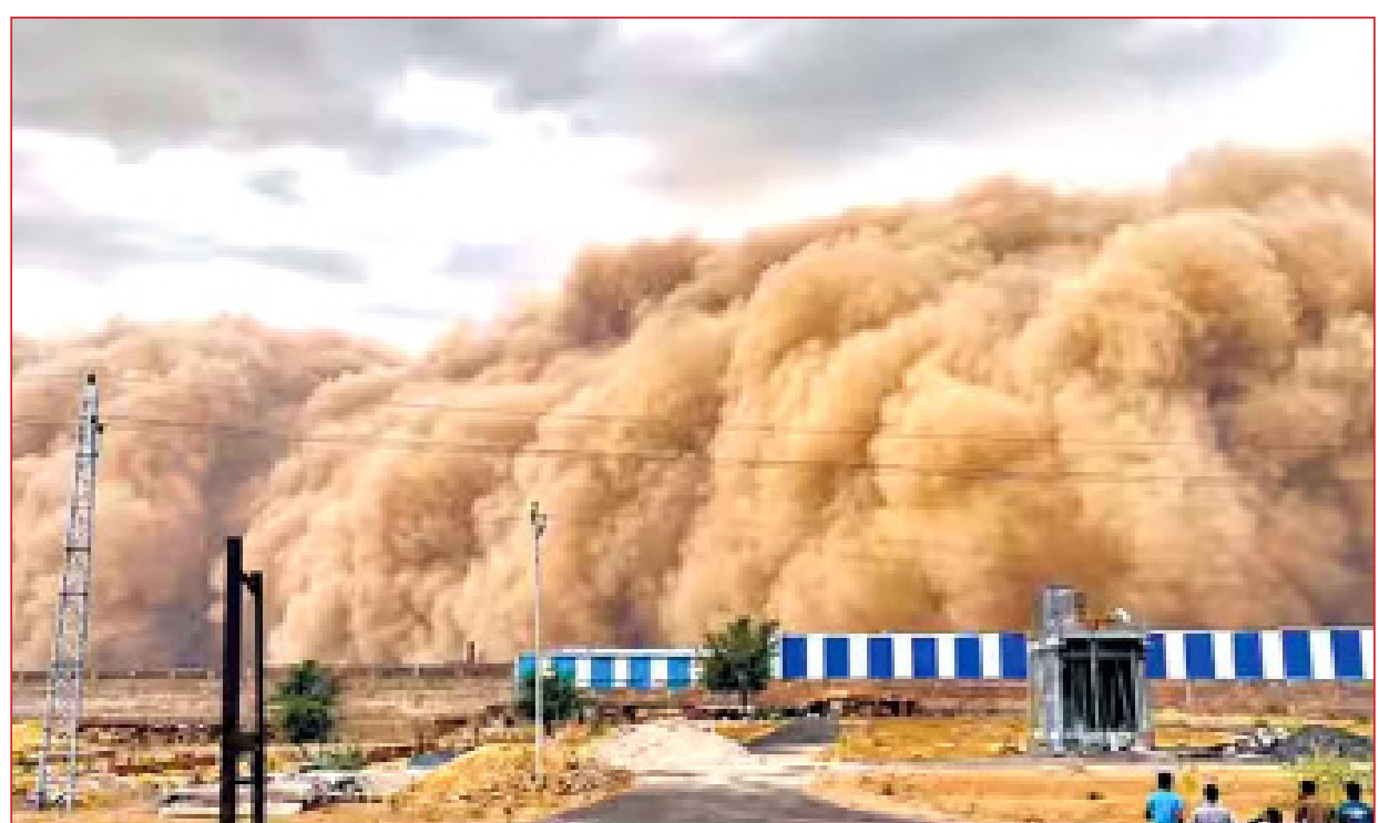
ராஜஸ்தான் மாநிலம் சூரிய பகுதியில் அச்சுறுத்தும் வகையில் மாபெரும் புழுதி திரண்டு வருவதை பார்த்து மிரண்டு நின்றவர்களை படத்தில் காணலாம்.

குடும்பங்கள் இத்திட்டத்தால் பலன் அடைந்துள்ளன. பிரதமர் நேரத்திரி மோடி தலைமையின் கீழ் தொடங்கப்பட்ட இத்திட்டம், அரசின் சுயசார்பு இந் தியா மற்றும் வளர்ந்த இந்தியா 2047 ஆகியவற்றின் முக்கிய தூண்களாக முன்னிறுத்தப்பட்டுகிறது.