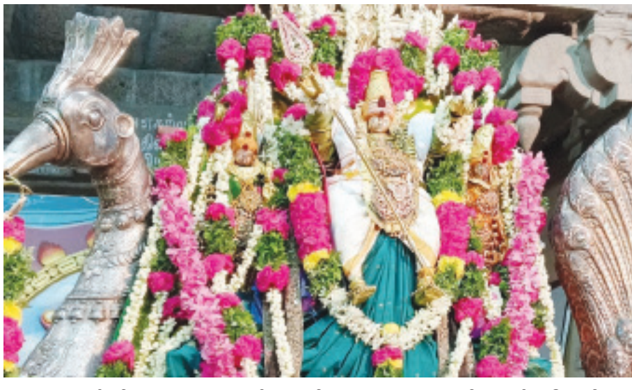
வைகாசி விசாகத்தை முன்னிட்டு விருதுநகர் வாலசுப்பிரமணிய கோவிலில் சுவாமி, வள்ளி தெய்வானையுடன் வெள்ளி மயில் வாகனத்தில் எழுந்தருளி வீதியிலாவந்து பக்தர்களுக்கு அருள் பாலித்தார்.

புதிய டிஜிட்டி நியமிக்கப்பட்டுள்ளதால், தமிழக சட்டம் ஒழுங்கு முழுமையாக பாதுகாக்கப்படும். எடப்பாடி தொகுதியில் குதிரை பேரம் மூலம் தலையிட்டு வேட்பாளரை பழனிசாமி விலைக்கு வாங்கி உள்ளார். அதன்மூலமே அந்த தொகுதி மிகவே வேட்பாளர் பழனிசாமி வெற்றிபெற்றார். எனவே, தலையிட்டு சிக்கு பலர் வருவதைப் பற்றி பேச அவருக்கு தகுதி கிடையாது என்றார்.